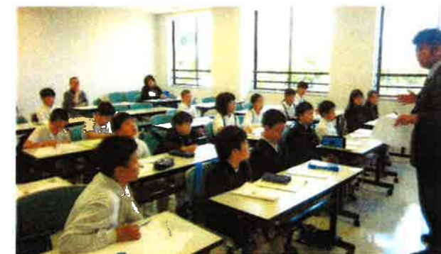
オリンピック支援講座では、講師の話に集中して...