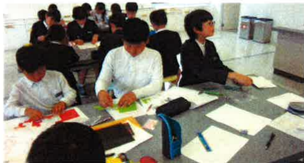
5年 Tパズルで試行錯誤して、いろいろな形を...

また、オリンピック支援講座で検定に向けて頑張っているクラブ員の真剣な表情もあり、うれしく思っています。