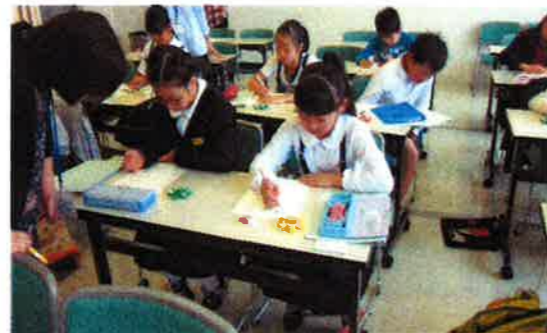
教具「ジャマイカ」で先を見通した計算結果を四則で完成させることできた?