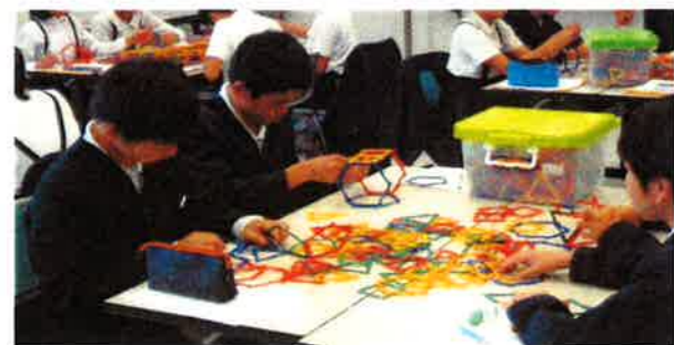
6年 オイラーの法則? 実際の立体図形づくりから...