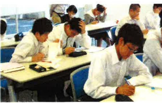
中2 頭を抱えて過去問に挑戦「うーん!」