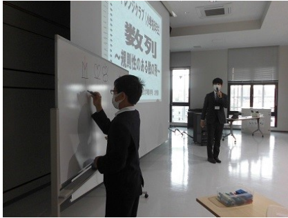
自分の考えを説明するクラブ員

6年生講座では、『数列脳トレ』に取り組みました。例えば、『1、□、5、7、9、11、13』といった数列であると、□は3ですね。答えを見つけるだけではダメで、なぜそうなるのか理由が2つ以上言えないといけません。「2ずつ増えてるよ。」「奇数です。」「2の倍数+1です。」といったところが、『算数する心』につながるのです。