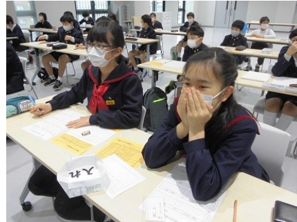
数列の決まりを見つけ出そうと思考中

5月8日(土)5年生は2回目の講座でした。ベース型の工作用紙を4つのピースに切り分けて大きなTの字を作ります。このTを崩していろいろな形に作り直していくからTパズルです。ピースの置き方をちょっと工夫しないと指定された形になりません。でも、17のパズルをコンプリートした強者が7人もいました。素晴らしいですね。