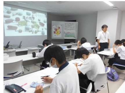
中学3年生「薬の数学」 有効に効く薬の量と時間を計算し、患者に調合する。