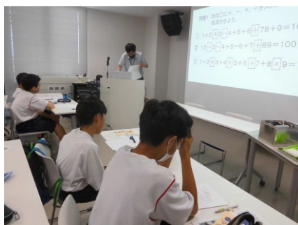
中学1年生「数学脳トレ」 四則計算を用いて答えが100になる小野小町算に挑戦している。