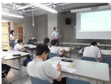
中学2年生「暗号と数学」 数学の考え方を使った暗号の作り方を知り、暗号を解読する。