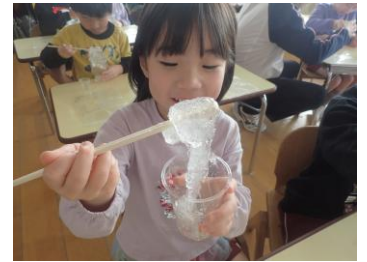
スライムづくり 「うわー、ねばねば～！」