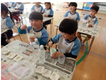
化石レプリカを作ろう 「しっかりまぜるよ」