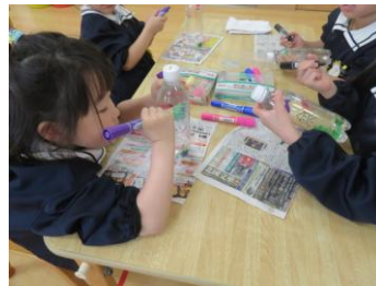
ミニ水族館づくり 「さかなをかくよ」